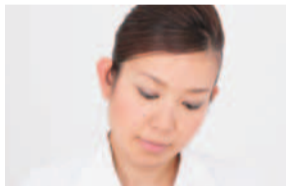
圧を加えて、溜った脂肪や老廃物をギュ〜とリンパに流す。「イタ気持ちいい」と感じるほど、脂肪や老廃物が溜まっている証拠。目元や口元、輪郭がどんどん引き上がるのを実感。一回り小さくなったフェイスラインに感激まじりなし。