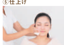
オリジナルの化粧品を使った十分な保湿で仕上げ。小顔美人の完成!