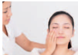
クレンジングでしっかり汚れを落として肌をリセット、清潔に。