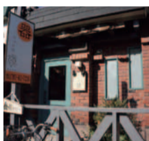
「悪い夢を食べてくれる猿」にちなんでつけられた店名。