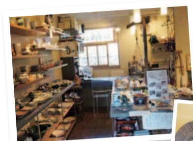
窯元から直接仕入れた表情豊かな和食器が並ぶ