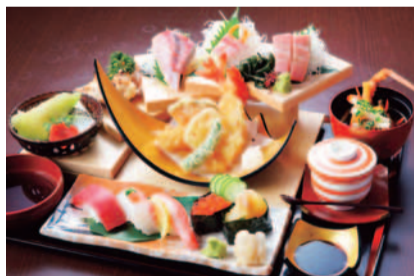
こんびら寿御膳(2,980円) 読者特典で得に!

海老を使った「新春特別膳」(限定20食)。伊勢海老のグラタン、伊勢海老の赤だし、刺身、天ぷら、鮎、茶碗蒸し、デザート付きというぜいたくさで、おめでたい気分がより盛り上がる。