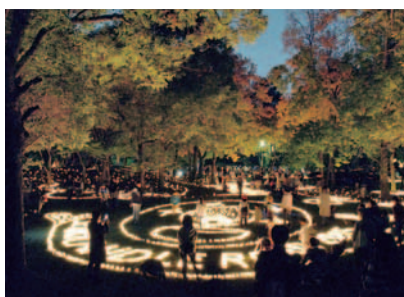
緑に囲まれたSENRI CANDLE ROAD 2015

この秋、千里中央公園(豊中市)は9万個のキャンドルで明々と照らされた。千里ニュータウンのまつりとして定着してきた「千里キャンドルロード」です。朝7時、約50人のスタッフによる落葉の清掃からスタート。9時頃から、子どもも高齢者のボランティアが集まり始め、紙コップに土とロウソクを入れて並べます。今年のテーマは「愛」にちなんだ大きなハート、いろいろな動物の形ができていきます。着火式のあと、約1300人のボランティアは、思い思いの場所で火をつけまします。ステージではダンスや歌。日が暮れるとキャンドルが暗闇に浮かび上がり、1万人以上の来場者から、きれいな声があがります。