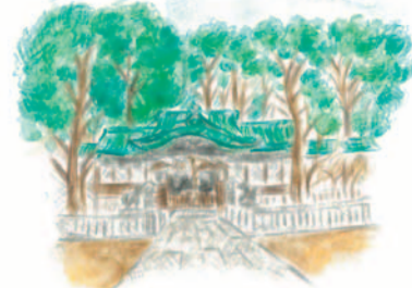
すがすがしい雰囲気のある菅屋神社

さらにゆかりを求めらるなら、菅屋神社に行ってみよう。本殿に向かって左の木陰の中に、猿丸大夫の墓と伝えられる石塔がある。かなり古いもののように、説明板によるとこれは鎌倉時代の