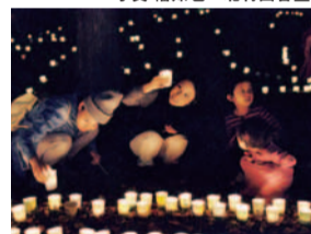
私の描いた紙コップあるかな？