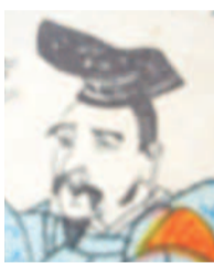
生没年不詳。平安時代の伝説的歌手。913年頃に成立した「古今和歌集」にその名があるが、他に実在を示す記録がない。「和漢朗詠集」の選者・藤原公任(966~1041)は、紀貫之、小野小町らとともに三十六歌仙の1人とした。藤原定家(1162~1241)は、本文にある歌を大夫の歌として百人一首に選した。故地としては他に京都・宇治原原町、大津市など。

スマホ、ネット全盛のいま、お正月に百人一首という人は少数派だろうか。「奥山に紅葉(もみじ)ふみわけ 鳴く鹿の 声聞くときぞ秋はかなしき」という一首がある。詠ったのは猿丸大夫という人。ことしの干支(えと)は申(さる)だから、このカードは縁起がいいのかも…。