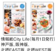
情報紙CityLife(毎月1日発行) 神戸版、阪神版、北摂EAST版、北摂WEST版