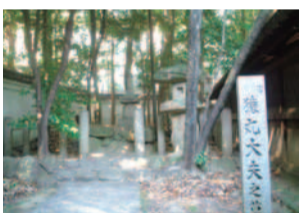
猿丸大夫の墓と伝わる宝塔

る開森橋の東たもと。有名な谷崎潤一郎の「細雪」がある、そのそば。安時は江戸末期、明治初めの人で、吉左衛門の親類にあたる。大夫の第44代を自称したそう。