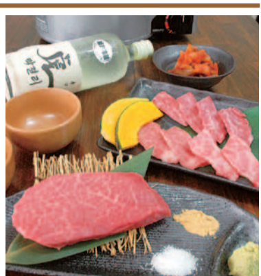
三島の仕入れでは、徹底して肉質にこだわるため、地域を絞らずその時の肉質が一番良い黒毛和牛を厳選し、リーズナブルに提供!

きめ細かい良質な厳選「国産黒毛和牛肉」を、リーズナブルな価格で提供しており、家族連れや友人との食事に人気の同店。今夏の開店以来、その上質な肉質が早くも評判になっており、毎日の仕入れにこだわる同店では焼肉のみならず、「牛トロにぎり」や「特選和牛たん刺」といった、鮮度が高いからこそ旨い逸品も好評!特に、特選ステーキは肉の旨さを追求したおススメの一品。美味しいお肉を、ぜひ食べてみて!