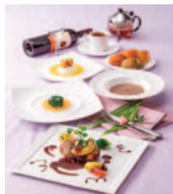
「リュクスコース」(全6品)2,480円。

「おしゃべりランチコース」(全6品)1,290円。スープ・前菜・メイン4品より選択・デザート・焼き立てパン食べ放題(ライス)・飲み物。+380円でデザートスタンド(全6品)。(16時まで・土日提供・税別)