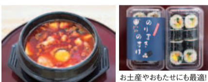
激辛サンドップチゲは、具沢山のお鍋。辛さの調節は希望できる。(ご飯つきもOK!)