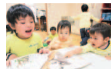
「生きる力に不可欠な人間力形成に軸を置いたメリハリ保育」が同園の教育・保育方針。

1歳半から入園可能で、卒園時には表現力、文章力、読書力等バランスのとれた高いレベルの英語力がつく評判のスクール。道徳指導にも力を入れ、日本の幼稚園プログラムをベースに園運営を行っている。ネイティブ講師に加え、経験豊かな日本人講師も協力をしっかり固めているので、保護者からも安心と好評。幼稚園・小学生対象のレベル別英会話クラスも併設し実用英検準1級にまで対応。只今クラス見学・入園説明会を開催中! HPには一日の流れや年間行事など子どもたちの楽しい様子が多数掲載。こちらまでぜひチェックしてみてください。