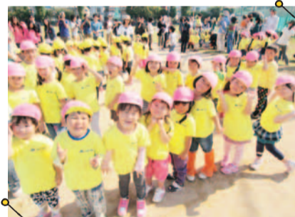
信頼関係を築き、助け合う心、感謝の気持ち、責任感、自分の意思を伝えることの大切さなども学ぶ。

1歳半から入園可能で、卒園時には表現力、文章力、読書力等バランスのとれた高いレベルの英語力がつく評判のスクール。道徳指導にも力を入れ、日本の幼稚園プログラムをベースに園運営を行っている。ネイティブ講師に加え、経験豊かな日本人講師も協力をしっかり固めているので、保護者からも安心と好評。幼稚園・小学生対象のレベル別英会話クラスも併設し実用英検準1級にまで対応。只今クラス見学・入園説明会を開催中! HPには一日の流れや年間行事など子どもたちの楽しい様子が多数掲載。こちらまでぜひチェックしてみてください。