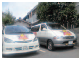
教室から4km以内なら送迎(オプションサービス)有り。

阪神間で評判の幼児英会話教室「リッツナーサリースクール」では、生活体験型レッスンでネイティブのような自然な英語が身につく。1歳半からの「プレアップルコース」で、期間限定のお試しレッスン3,000円(2回レッスン・入会金不要)を開講!1回30分、ママと一緒にだから無理なく英語体験ができる。吸収の早い幼児期から、親子でトライ!