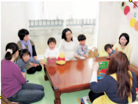
親子間のコミュニケーションも育まれる楽しいレッスン! 子ども同士の交流はもちろん、子育てに励むママ達との出会いも魅力のひとつ。まずはお得なお試しレッスンから始めて、我が子の様子を見守ってみよう。

阪神間で評判の幼児英会話教室「リッツナーサリースクール」では、生活体験型レッスンでネイティブのような自然な英語が身につく。1歳半からの「プレアップルコース」で、期間限定のお試しレッスン3,000円(2回レッスン・入会金不要)を開講!1回30分、ママと一緒にだから無理なく英語体験ができる。吸収の早い幼児期から、親子でトライ!