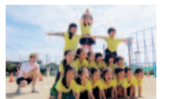
「有効な年齢の間に、潜在能力を最大限引き出してあげる環境が大切です」と園長先生。