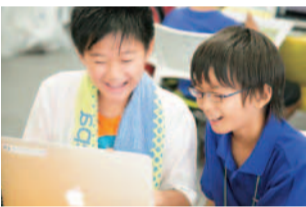
他の生徒が作ったゲームをプレイして、「もっとこうしたら面白いんじゃない?」と、お互いを刺激しあう高め合う場面。