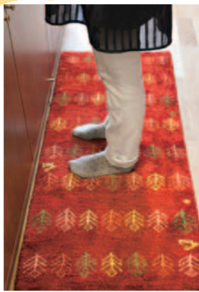
床からの冷えが軽減されるので冬は特にありがたいアイテム。汚れにくさも使いやすい点。