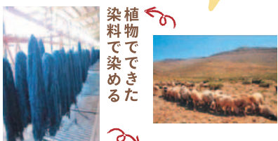
植物でできた染料で染める