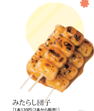
みたらし団子 [1本120円(2本から販売)]