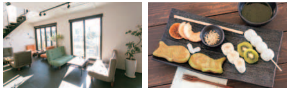
[右] 宇治抹茶チョコレートフォンデュ1,350円。鯛焼き型パンケーキやお団子などをほんのりあたたかい抹茶チョコレートソースでいただく。 [左] 大きな窓から光が射し込み居心地も◎。

こだわりの5種類の餡から2本好きな餡を選べる。写真は栗をふんだんに使った粒入り栗きんとんと炒りたての香ばしい香りが漂う焙煎黒ごま餡。たっぷりの餡を載せたあたかなお団子にほうじ茶がよく合う。