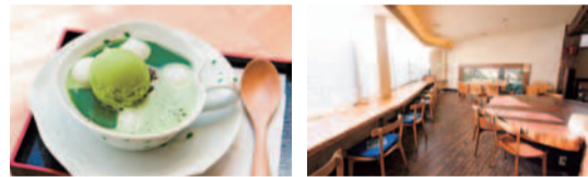
[右] 古民家の梁を使った風情ある店内。 [左] 抹茶ぜんざい648円。自慢のあんこが入った宇治抹茶に抹茶アイスと白玉を載せた冷製ぜんざい。さっぱりした甘さと抹茶のほろ苦さが大人の味わい。