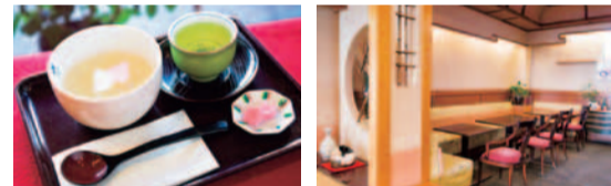
[右] JR芦屋駅南口にたたずむ千鳥屋宗家。本格的な和の空間。 [左] くず湯干菓子付き518円。くず・抹茶・桜くず湯・おしろい・しょうがの5種から選べる。とろっとした口あたりであたたまる。