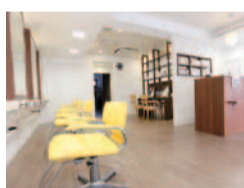
Ceres山田店。気さくなスタッフが勢揃い。