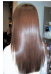
同店で施術したM3Dトリートメント

年初め、「今年こそ新しい自分を見つきたい」貴女にオススメ!同店はM3Dメニューを導入して8年と、実績多数の安心サロンだ。髪質を変えてツヤ髪にしてくれるM3Dだけでなく、その人に合わせたボリューム感を出すカット技術も抜群!気さくなスタッフさんが迎えてくれ、幅広い年齢層の方が通っているので肩肘はらずに行けるのも嬉しい。