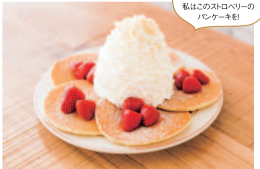
休日に家族でランチ気分を出かけてみるのもいいかも。