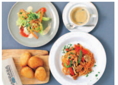
お洒落な雰囲気はママ友とのランチにぴったりですね。