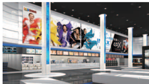
4DXシアターは、シーンに合わせて、雨・水・風・香・霧・泡・雷・雪・嵐などのエフェクトと、客席が前後・左右・上下に動くなど、15種類の特効果で映画の世界に飛び込んだような気分になれます。

話題のIMAXシアターは、日本最大級の高さ18m×横幅26mの巨大スクリーンに最新鋭の4Kツインレーザープロジェクターによる鮮やかな映像と12ch次世代サウンドシステムで迫力ある映像が楽しめます。他にも、テーマパークのアトラクションのように「ライドする(乗り込む)」4DXシアターでは臨場感を堪能できます。平日なら家事を早めに済ませて一人でゆっくり観に行くのもいいですね。