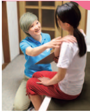
顎関節症・歯の食いしばり・顔の歪み・肩こり・頭痛・巻肩・エラ張り など

特典 新規の方・初回限定「シティライフを見た」と予約で(1月末まで) 外反母趾矯正が 50%OFF ●片足(30分)……………8,640円→ 4,320円 ●両足(60分)……………16,200円→ 8,100円 ●初診料……………1,100円→ 無料 詳しくはWEBでチェック! ※要予約