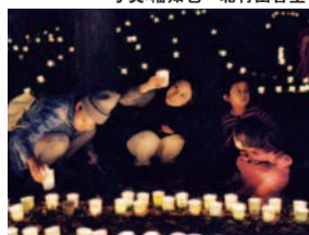
私の描いた紙コップあるかな?