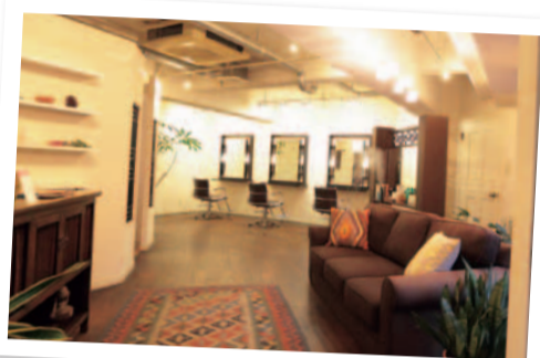
あたたかい照明が心地よい、大人かわいいサロン

個性をちゃんと分かってくれるサロンに出会って、本当に似合うヘアスタイルでおしゃれを楽しんだり、新しい趣味を見つけて充実した時間を過ごしてみるのもいいですね。50代からが、人生の“グッドシーズン”。さあ輝く毎日を始めましょう。