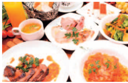
前菜3種、サラダ、スープ、お肉メイン、パスタ、デザート、パン食べ放題 と大ボリュームで、ソフトドリンク飲み放題付きのランチ女子会プラン!