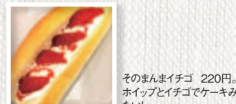
そのまんまイチゴ 220円。 ホイップとイチゴでケーキみたい!

取材協力 パン工房 メルクール 高槻市栄町2-5-11 営/9時~17時 日曜定休 ☎072-668-6934