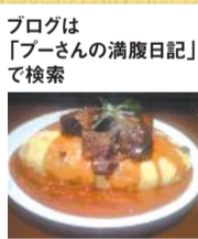
北摂を中心として美味しい店を食べ歩いている人気の有名グルメブロガー。

「栄町に美味しいコッペパン専門店が」と教えて頂いたので、早速「コッペパン専門店メルクール」へ。店内は注文したら作ってくれるスタイルで、急いでいる方にはショーケースに入ったものも。注文は、人気商品のこれを「塩やきそば」160円。注文が入ってから焼きそばも作られるのでちょっと時間がかかります。野菜も豚肉もたっぷり入っていて美味しそうですね。ではでは一口!ウルトラメチャ旨い!塩やきそばなんで、あっさりしていてパクパク食べられます。この内容で160円はすごくCPIいいですよ。いろんな所でコッペパン食べたことあるんですが、このコッペパンの美味しさは格別です。是非買いに行ってみてくださいね。