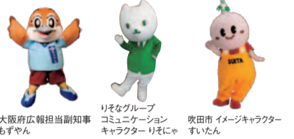
大阪府広報担当副知事 もずやん りそなグループ コミュニケーション キャラクター りそにゃ 吹田市 イメージキャラクター すいたん

●日時: 2/20(土)13:00~16:30(予定) ●場所: EXPO'70パビリオン1階 ホワイエ ●問合せ: 06-6944-6837(大阪府府政情報室)