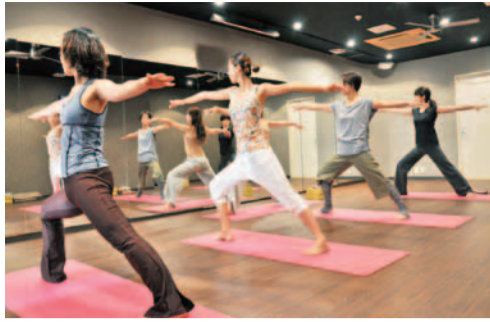
阪神間・神戸で会員数20,000人を越えるオクトワン。昨年は沖縄にも開校、老若男女問わず全国にファン多数。

暑い、苦しいが苦手な方は、「遠赤外線」を導入した甲子園スタジオへフロア全体から放出される遠赤外線効果で、身体の深部から末端までほっこり。心地よい温もりの中、ラクに最大限の効果を発揮。