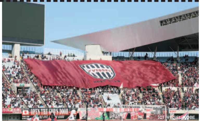
2015年12/26(土)にヤンマースタジアム長居で行われた天皇杯準々決勝、浦和レッズ戦。編集部ももちろんゴール裏で参戦したが試合は惜しくも0-3で敗戦。2016年は必ずや勝ち上がり決勝戦に臨みたいもの。

新しい年も始まって、あっという間に2月。2016年の明治安田生命J1リーグは2月27日に開幕を迎えるので、シーズンはもう目の前。今年もシティライフはヴィッセル神戸を熱く熱く応援していきます!!