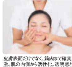
皮膚表面だけでなく、筋肉まで確実に刺激。肌の内側から活性化。透明感とハリが蘇り、肌質が変わっていくのを実感。