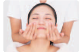
ほうれい線の原因になる溜まった脂肪や老廃物に働きかける。座って行うから血流やリンパの流れが3倍もアップするそう。