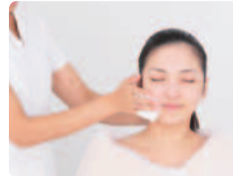
オリジナルの化粧品で、十分に保湿して小顔美人の完成。肌の若返りを実感!