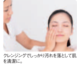
クレンジングでしっかり汚れを落として肌を清潔に。