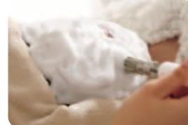
毛穴ケアにも定評がある同サロン。微細な泡で老廃物をクレンジング!毛穴汚れが気になる方もサロンへ問合せを。