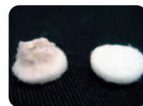
ダイヤモンドピーリングで毛穴の汚れもごっそりスタッフは全員ノーファンデというのも肌改善サロンの自信の表れ。