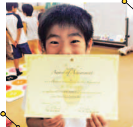
3ヶ月のステップ1を修了したら表彰状が! 満面の笑みが何よりの証拠!