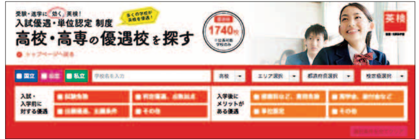
認定校1,740校(公表可能学校のみ)から、優遇校を探ることができる英検ウェブサイトの検索ページ。上記の「高校・高専の優遇校を探す」のほかに、「大学・短大」、「中学校」も検索できる。

今、親が子どもにいちばん身につけてほしいと願っているのが英語力だと言われています。将来、ビジネスシーンや世界で活躍するためのコミュニケーションツールとして必要不可欠なもの。その英語力を測る指針となる「英検」を取得することで入試の優遇や単位認定をする学校が増えてきているようです。