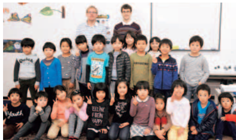
学童クラスは、入門クラス、初級クラス、中級クラスに加えて帰国子女クラスとレベルに応じてレッスンしている。