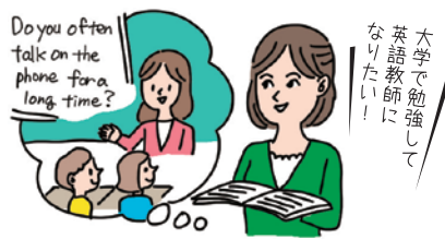
英検の入試優遇制度を利用して、夢に近づく。

また「英検」は英語力の習得のみならず、入試における学科試験免除、入学金・授業料免除や英語科目の単位認定など、学校によってさまざまな優遇措置を受けられるメリットがあるという。自分の夢や進学目標に一步近づけることができるこの制度は、ぜひ活用したいところ。