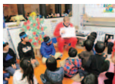
アットホームな雰囲気とみんな仲良しなので、楽しみながら能力を伸ばしていく事ができる。