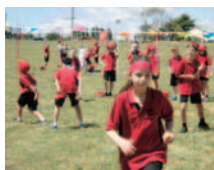
オーストラリア Buninyong Primary School の子どもたち。