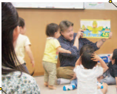
人気のBabyBox。親子で自然な英語に慣れ親しましましょう。