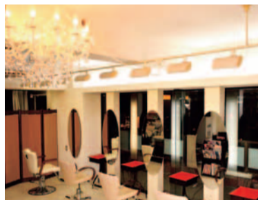
ガラス張りの窓から太陽の光が降り注ぐ、居心地の良い空間