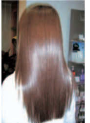
同店で施術したM3Dトリートメント

吹田 JOYDUCE 吹田市長野東17-5 KMマンション1F 営/9時半~18時半 月・第3火曜定休 ☎06-6876-2716