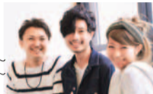
初めての来店なのにリラックスできる雰囲気!

特典 「シティライフを見た」と予約で 30%OFF (2月末まで・新規の方のみ)