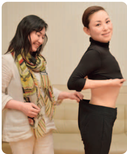
オーナー自身も同サロンで、10kgに成功&リバウンド知らず!とても51歳とは思えない美しいボディラインに説得力を感じる。

40代からのキレイの秘密がココにあり 短期集中であの頃の“くびれ・美脚”が 「痩せたいけど自分では限界が…」そんな美意識の高い40~60代の女性から圧倒的な支持を集める評判になっているのが同サロンだ。厳選したハイクオリティマシンはもちろん、スタッフの技術力の高さが特徴。「徹底した研修、レッスンを重ねた上で結果が出る者だけが施術します」というオーナーの言葉からスタッフの技術力への自信が感じられる。マシンと手技の合わせ技で、あの頃のボディラインを手に入れて。