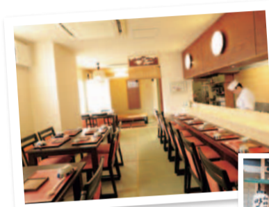
新御堂筋を北進した箕面・白鳥にある同店。朱の暖簾が目印。白鳥北バス停から徒歩すぐ。駐車場も5台分あり。

最近、寒くて元気が出ない...とお嘆きの皆さん、美と健康に良い「すっぽん鍋」を食べに出かけませんか?「すっぽんは高級食材だから...」という心配はご無用。50代からが人生の“グッドシーズン”。さあ輝く毎日を始めましょう。