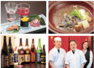
夜は日祝のみ。鍋の他にすっぽんの造りや揚物、雑炊などがついたコースのほか、すしを含むおまかせコースも。

すっぽん鍋ランチコース (コーヒー・和菓子付)2,750円(税別) サラダ、珍味(肝串焼き・すっぽんの卵醤油漬け)、椀物(すっぽんの出し巻き)、すっぽん鍋、ご飯、香の物