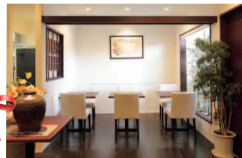
白で統一された洗練された雰囲気店内。

前菜/スープ/点心2種/海鮮2種と季節野菜のガーリック炒め/豚肩ロース肉と彩り野菜の黒酢の酢豚/ライス/榨菜/デザート(杏仁豆腐orマンゴプリン)