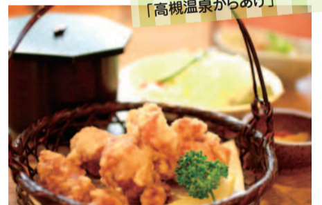
美人湯 祥風苑 「高槻温泉からあげ」