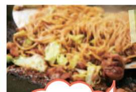
真庭市「ひるぜん焼そば」