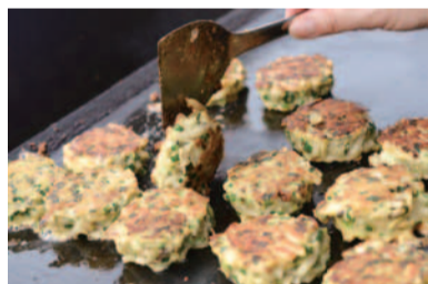
高槻うどんギョーザの会 「高槻うどんギョーザ」