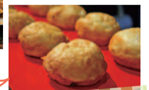
明石市「あかし玉子焼」(明石焼)