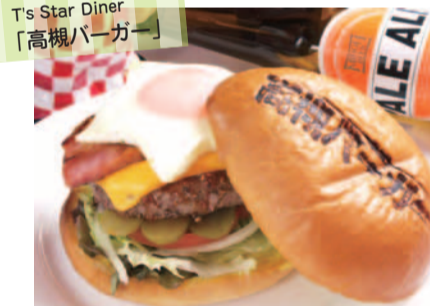
T's Star Diner 「高槻バーガー」