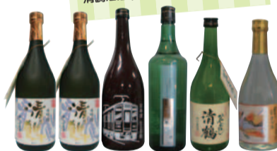
清鶴酒造(株) 銘酒「清鶴」ほか