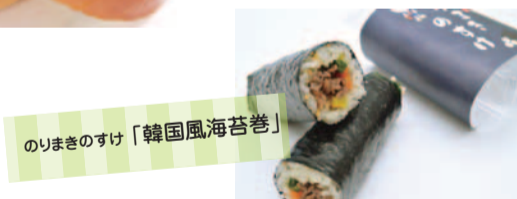
のりまきのすけ「韓国風海苔巻」