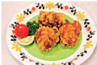
からあげ大吉 高槻すえひろ店 「中津唐揚」