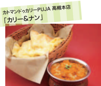
カトマンドゥッカリ PUJA 高槻本店 「カレー&ナン」