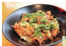
薩摩の牛太 寿店 「とて焼きうどん」