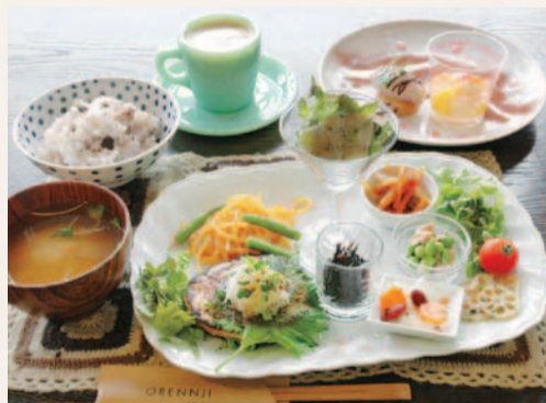
日替りごはんランチ.....1,000円

店内にはビンテージの家具やファイヤーキングの食器が使われていて、大人が一息つきたくなるほど居心地の良い隠れ家的なお店。料理も食材にこだわり、茨木の地野菜や十六穀米を使用する等とてもヘルシー。人気店なので、事前に予約するのがベター!