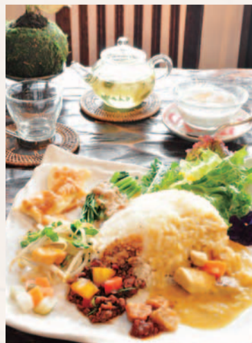
6周年記念むばらけパワーランチ.....1,200円