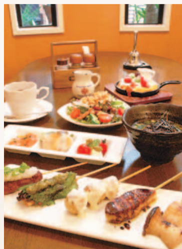
炭火焼き変わり串ランチコース...1,500円

前菜3種、串焼き5種、サラダ、しょうが入りおこげスープ、 コーヒーor紅茶orソフトドリンク