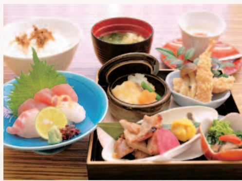
彦ランチ.....1,400円(1日限定10食)