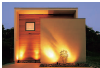
(上)知っているのと知らないのでは、あなたの人生が大きく変わってしまうかも!?

マイホームの購入は、検討前のちょっとした知識で何百万円もの差が生まれることもあるという。また、約70%の人が購入後に後悔しているというアンケート結果もある。このセミナーでは後悔しないための住宅購入の知識を得られるのと同時に「知っておくだけで500万円得する!?マイホーム資金計画」を知ることができる。住宅はまだ無理だと思っている人や、現在検討中の人、物件を探している人もぜひ参加して。キッズスペース有り。