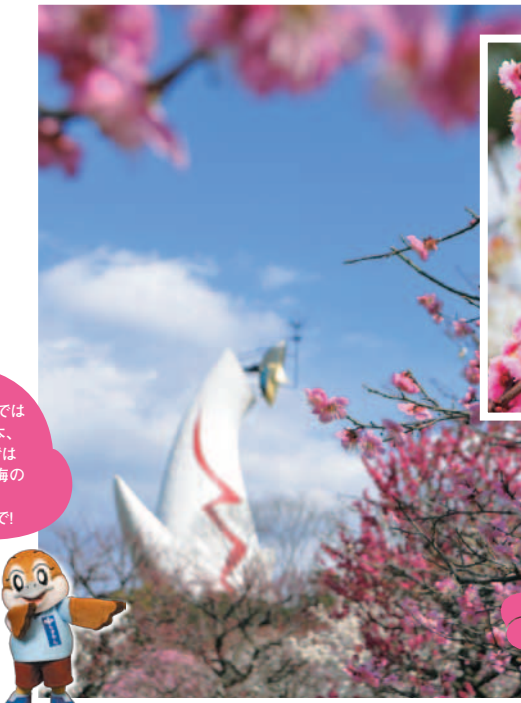
(上)日本庭園梅林 (左)自然文化園梅林

自然文化園の梅林では123品種・約600本、日本庭園の梅林では37品種・約80本の梅の花が咲いて、みんなを待ってるで!