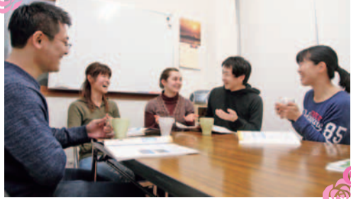
それぞれの近況など身近な話題を英語で話すフリートークが中心。クラスは90分以上あり、超初心者から上級者までレベルに合わせて無理なく習える。