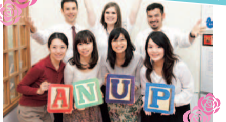
名作を読み進めることで、その国の文化的、歴史的背景にもふれられ、教養が深まる。学生時代に学んだ基本的な英文法が呼び覚まされるから、ブランクのある人も躊躇することなくはじめる。

無料体験会開催 ●対象:大学生・成人 ●申込:前日までに要予約 ●場所:各講座開催場所と同じ ●日時:各日13時~14時半 [Sushi and Beyond]…3/16(水)、4/6(水) [Star Wars The Force Awakens] ……3/19(土)、4/9(土)