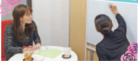
清潔感あるキレイな教室ではブース毎にバージョンで区切られ、周囲を気にせず集中できる。「テキストを使用しないフリートークのみのレッスンにも柔軟に対応してくれるのでありがたい!」[スクールを利用した分のみの明細会計なので料金体系がわかりやすい]と好評。