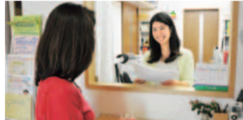
受付では、親切なスタッフがわからないことを何でも聞ける。気になることがあれば気軽に電話で問合せみて。