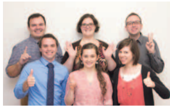
教会から推薦を受けた信頼性の高い講師陣。どの先生も熱心で優しく、話しやすいと支持されている。間違っても、ゆっくり正しい表現を教えてくれるので初心者も安心。

アメリカ人講師とのコミュニケーションを中心としたレッスンが評判の同スクール。90分の少人数制なので発言の機会はたっぷりあり、実践的な会話力がぐんぐん上達する。海外旅行前の準備にもピッタリだ。「英語力上達には楽しむことが一番の近道」なので、雰囲気がアットホームで続けやすいのも魅力。日常と異なるそんな時間は、毎日にハリや豊かさをもたらし、仲間が話す新鮮な話題や言葉に自分の世界も広がるそう。休んでも授業の振り替えは電話1本でOKと無駄もない。今なら希望通りの時間のレッスンを受けやすいので、4月新学期に先駆けてスタートしてみても、まずは気軽に無料体験レッスンへ!