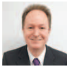
米西海岸出身のディーン先生。陽気な人柄、柔軟な指導にファン続々。ネイティブ講師多数在籍、お気に入りの先生に出会える!

上質なネイティブ講師が多数在籍する同スクールでは、学びの目的・目標・レベル・相性を見極め、最適な講師を選出してくれる。上達が期待できる1対1の受講形式にこだわり、短期間での初心者脱出を完全サポート!従来のグループレッスンでは効果を感じられなかった人、英語を基礎から学び直したい人や長年英語に触れていない人には中学英語からの丁寧なレッスンで誰でも安心できる。