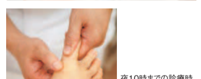
夜10時までの診療時間も、忙しい女性には嬉しい!(要予約)

歩くと痛い靴が履けない等の外反母趾を独自の手技で矯正。これまで器具やグッズでの矯正法は有ったが、手技で矯正するのは兵庫県で同院が初めて。外反母趾をそのままにしていると歩きかたが悪くなって、O脚や寝たきりになる可能性も...。外反母趾がよくなったと噂を聞いて遠くは沖縄・広島・静岡からわざわざ通う人もいるほど。まずは問い合わせしてみてください!