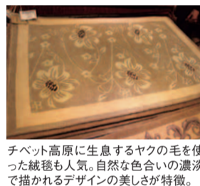
チベット高原に生息するヤクの毛を使った絨毯も人気。自然な色合いの濃淡で描かれるデザイン的美しさが特徴。