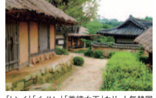
「トンイ」「イ・サン」「善徳女王」など、人気韓国ドラマが撮影された「龍仁大長今パーク」。数百年前の韓国の宮廷や下町が忠実に再現され、タイムスリップしたような感覚に。