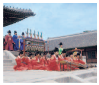
世界無形文化遺産に登録されている「宗廟大祭」。伝統衣装をまとい、雅楽が響く中、厳かな儀式が盛大に執り行われる。その様はまるで、華麗な朝鮮王朝の時代絵巻さながら。

同社が提案する、 添乗員といくテーマがある旅「風神花姫」から、 歴史的・芸術的な価値が高い韓国の文化にふれられるプランが登場。年に一度だけ行われる韓国最大の伝統行事「宗廟大祭」をはじめ、世界遺産・伝統家屋の散策など、優雅な朝鮮王朝時代を体験できる。食事は定番韓国料理に加え、李氏朝鮮時代より伝わる韓国宮廷料理も愉しめる。韓国ドラマファンも必見。今年のゴールデンウィークは雅な世界に思いを馳せてみては？パンフレットの請求や、詳細の問合せは下記まで。