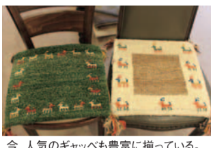
今、人気のギャップも豊富に揃っている。

その色合い、デザインは見れば見るほど美しさと精巧さに感嘆の声が上がる。使う美術品といわれる所以「ゆえんだ」「製作に長い時間をかけているので、良い手織絨毯には良い気（エネルギー）」とか、ぬくもりが醸し出されて愛着が湧いて生の友となります」とオーナー。