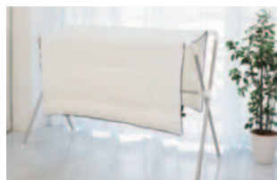
※平成24年度特許登録。写真の左がエアーフレイク。右が通常のポリエステル綿。

なにより、温かく軽いというのがもうひとつの大きなメリット。ランドリームは布団が体に沿うように工夫されているので、熱が逃げにくく、高級品として知られる羽毛布団と同等の保温力があるという。なぜ、この軽さと温かさが実現できたのだろうか？その秘密はクラボウが独自に開発したAir Flake(エアーフレイク)という素材にある。