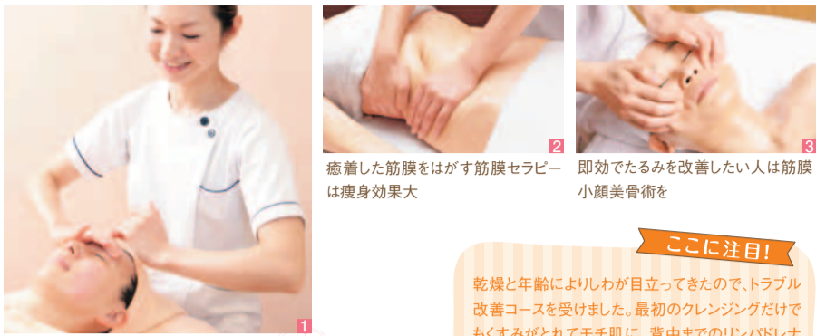
癒着した筋膜をはがす筋膜セラピーは痩身効果大 即効でたるみを改善したい人は筋膜小顔美容術