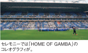
セレモニーでは「HOME OF GAMBAs」のコレオグラフィが。