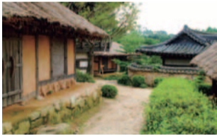
「トソイ」「イ・サン」「善徳女王」など、人気韓国ドラマが撮影された「龍仁大長今パーク」。数百年前の韓国の宮廷や下町が忠実に再現され、タイムスリップしたような感覚に。