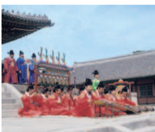
世界無形文化遺産に登録されている「宗廟大祭」。伝統衣装をまとい、雅楽が響く中、厳かな儀式が盛大に執り行われる。その様はまるで、華麗な朝鮮王朝の時代絵巻さながら。