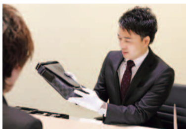
モノの価値を見極めるだけでなく、その品への想い入れも汲み取ってくれるから気持ち良いやり取りができる。

箕面唯一の質屋が桜ヶ丘にオープン。海外にまで広がった独自の流通ネットワークと豊富なデータベースが同店の強みで、「宝石、貴金属ならどこにも負けない買取額を呈示できます」と鑑定士の谷川さん。絶対の自信を持つプロの