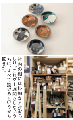
社内の棚には掛軸などが並び、しりこが1週間もしないうちにすべて捌けるというから驚きだ。

●花かご(買取強化中) ●鉄瓶・銀瓶 ●抹茶茶碗 ●茶道具 ●木彫(能面等) ●焼物 ●刀装具 ●華道具 ●灯火器 ●蒔絵 ●日本画・中国画・仏具 ●煎茶道具 ●車物 他 問合せを 縁なら宅配で買取サービスが利用できます ※訪問も可能 電話、メール、FAXで問合せ後、担当者が品物の数や種類をお伺いし、宅配キットをお送りします。お客様ご自身で梱包していただき、弊社へお送りください。査定額にご納得いただけましたら、お振込いたします。※査定価格にご納得いただけない場合は、すみやかにご返却いたします。