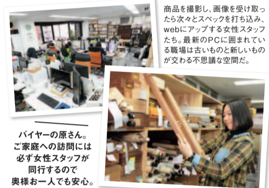
商品を撮影し、画像を受け取ったら次々とスペースを打ち込み、webにアップする女性スタッフたち。最新のPCに囲まれている職場は古いものと新しいものが交わる不思議な空間だ。

「そろそろ実家の整理をしなくちゃ…」とお考えの方もいらっしやるのでは?そこで出て来た古道具たちが、意外とお宝に化ける可能性があります。一度、気軽に鑑定してもらってみてはいかがでしょうか? 50代からが人生の「グッドシーズン」。さあ輝く毎日を始めましょう。