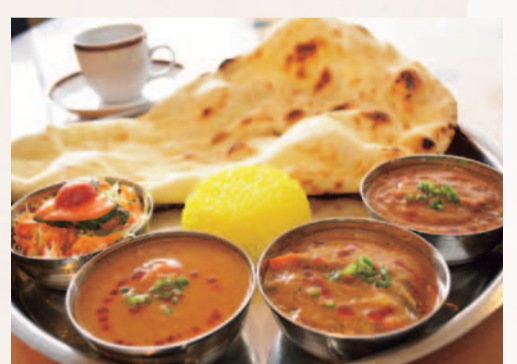
ナン食べ放題 Cランチ...1,100円 ※ディナー時は1,188円

インド人シェフが野菜と香辛料をベースに仕上げる本場の味で愛される同店。キャンペーン中につき、すべてのランチがナン食べ放題!ディナーのアラカルトカレーが半額!お得なこの時期に本格カレーを堪能してみよう。