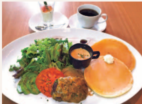
チーズハンバーグとアボカドの パンケーキランチ...1,380円(ドリンク付)

神戸で人気のカフェが箕面にもオープン!ランチは人気高いパスタランチ3種に加え、おかわりパンケーキランチにも注目!ハンバーグは系列の焼肉店から取り寄せた本格黒毛和牛を使用しており、際立つ美味しさ。休日の午後はグラスワインの付く牛タンを煮込みランチでゆったりランチを。