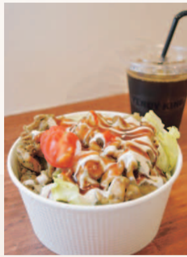
チキンオーバーライス S580円、M750円、L850円 (ドリンク付)