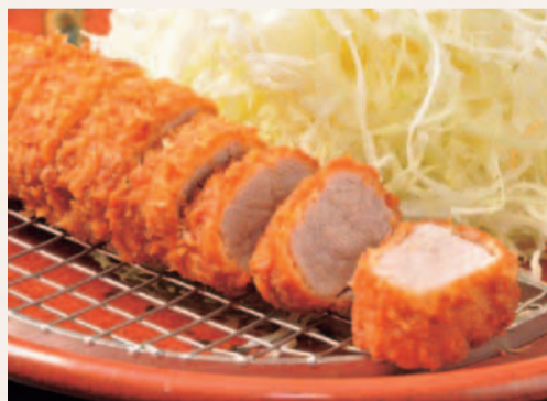
四元豚へれかつ定食 四元豚へれかつ(130g)、キャベツ、御飯、赤出汁、漬物(キャベツ、御飯、赤出汁はお替り自由) ...1,250円

千里中央駅目の前、赤いのれんで知られるとんかつ専門店。奇跡の血統「四元豚」は麦育ちの柔らかく上品な味わい。肉の旨みを最大限に引き出したジューシーな甘みを実現している。創業から伝わるへれかつにぜひ舌鼓を。持帰り弁当もあるため駅近お土産にも。