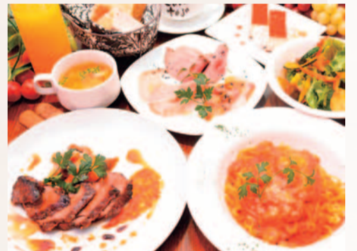
ランチ女子会プラン...読者限定 1,480円

良質な食材で仕上げるイタリアンが食べきれないほどのボリュームで並ぶランチプラン。3月は、ごちそう感たっぷりの「生うのにトマトクリームパスタ」が登場!パンとソフトドリンクは食べ飲み放題、しかも読者限定価格。これで女子会は盛り上がり!