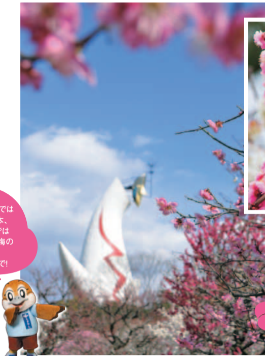
(上)日本庭園梅林 (左)自然文化園梅林

自然文化園の梅林では123品種・約600本、日本庭園の梅林では37品種・約80本の梅の花が咲いて、みんなを待ってるで!