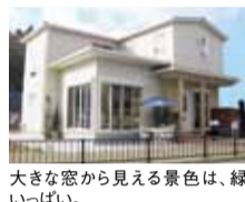
大きな窓から見える景色は、緑いっぱい。

●デルソーレコース(ディナー)……お二人様 3,800円 オードブル盛り合わせ・具だくさんのトマトスープ・自家製パン・パスタ・デザート・コーヒー 特典「シテイライフを見た」でランチは プチデザートサービス 夜は ワンドリンクサービス (4月末まで)