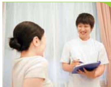
夜10時までの診療時間も、忙しい女性には嬉しい!(要予約)

特典 新規の方・初回限定「シティライフを見た」と予約で(4月末まで) 外反母趾矯正が特別価格に! ●片足(40分)……………9,800円→7,000円 ●両足(60分)……………18,000円→12,000円 詳しくはWEBでチェック! ※要予約