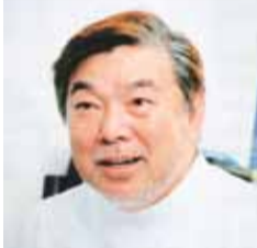
ゴッドハンドを頼って遠来の通院も多く、確かな実績で信頼は厚い。諦めていたどんな症状もぜひ相談してみてください。

“西のゴッドハンド”として慕われる山村館長。オリンピック強化選手の専任メディカルトレーナーとして活躍。知識の豊かさは、明治東洋医学院では25年間教鞭を執ったという経歴からもうかがえる。そんな数々の実績に基づき的確に診断し、丁寧に施術。痛み・自律神経の不調・股関節の変形・重症ヘルニアといった深刻な不調も短期改善を目指してくれる。ほかで「完治は無理」といわれた人も多数来院。