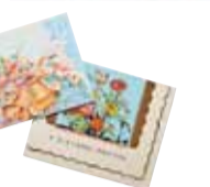
昔の印刷の味わいが楽しめるグリーディングカード(各648円)

古いパティの生地をアクセサリにアレンジしたオリジナルアイテム。イヤリングやピアスなど(2,367円～)