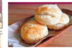
ファームハウススコーン(200円)