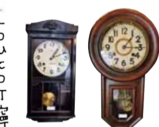
一つひとつの 時計に 個性が 溢れる

●神戸市中央区海岸通4-3-17 清和ビル11 営/13時～20時 土曜定休 TEL 078-371-1115 http://www.pillikenantique.jp