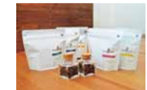
扱う豆は6種類以上。豆の販売もしている(100g 450円～)