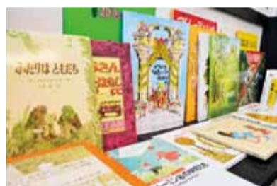
色とりどりの ガリィな古書店