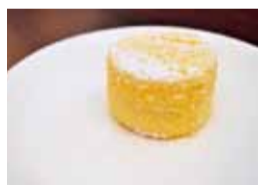
ディジマ(540円)マスカルポーネとクリームチーズの2種のチーズが口の中でふわりと溶ける。