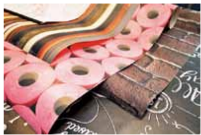
1ロール(長さ10m前後・幅50cm)4,500円～家具などに貼って楽しむのもオススメ

●神戸市中央区海岸通4-3-17 清和ビル11 営/13時～20時 土曜定休 TEL 078-371-1115 http://www.pillikenantique.jp