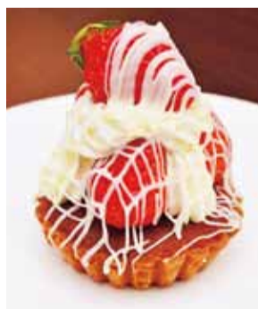
苺のタルト(560円)生クリームと苺のフレッシュな甘さに、タルトのサクサク感が程よいバランス。食べ応え抜群。