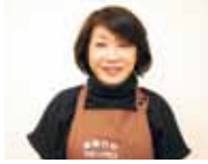
育児経験のある40代以上のスタッフばかりなので安心。

神戸・芦屋 家事代行 マザープラス 神戸市東灘区御影石町 ※サービス対応地域 神戸市、芦屋市、西宮市 間/9時~20時 営/9時~18時 ☎0120-56-0310 http://mother-plus.com/ 家事代行 マザープラスで検索