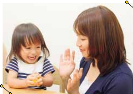
親子でレッスンに参加できるので、子どもと一緒に成長できるとママたちにも好評。専門家による保護者へのフォロー体制もあるので安心。

無料体験レッスン実施中! ●開催日時: 詳細は電話にてご確認ください。 ●場所: 当教室(各レッスンごとに先着6組まで) ※無料体験会の予約は☎0800-777-8777(携帯・PHSからもアクセス可)まで。