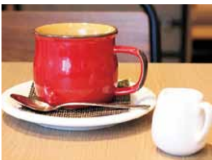
ポケットオリジナルブレンドコーヒー (450円)