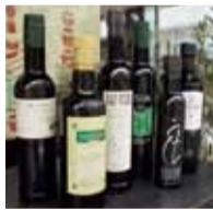
作り手によって香りや風味など特徴がある。

オリーブの品種は2,000種を超えると 言われ、その品種や地方によって辛い 甘いまるやかな個性があり、価格帯も 様々。迷った場合は何にでも合う、まる やかでクセのないタイプを選ぶと良いで しょう。1日大さじ1~2杯を目安に摂取を。