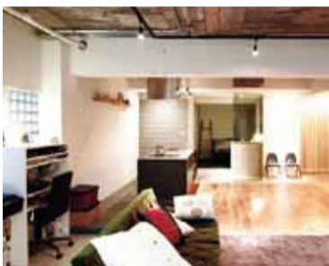
「最適な住宅購入」を実現できるように、様々なパターンを想定したシュミレーションを加えたおすすりセミナー