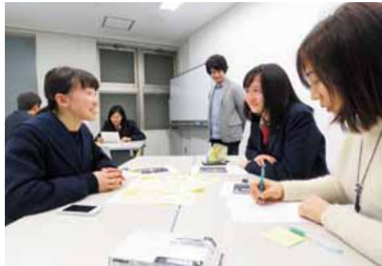
初対面ながらも和やかな雰囲気で行った「アクティブラーニング」の授業。3人それぞれの意見をふせんに書いて、述べながら1枚の紙に貼っていく。書記を1人選び、グループの意見をまとめて、発表するための原稿を仕上げる。

できるのが期待できるのか？ これは、今後の大学入試対策としてだけでなく、将来社会で活躍するためにもぜひ身につけたい能力。グローバル化、高度情報化が進み、世界中の人たちとコミュニケーションする機会が増える中、旺盛なチャレンジ精神で新しいものを創造し、世界に発信する力につながると期待されています。