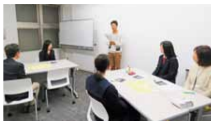
最後は話し合った内容をまとめ、発表者が1分間でプレゼン。3人のアイデアが詰まった、面白いストーリーが完成した。同時に、話し合った断片的な内容を1分という時間ばかりにまとめる難しさも実感。

教師による講義を受動的に聞いて暗記するこれまでの学習とは違い、グループディスカッションやプレゼンなど、主体性を持って考え、自らアクティブ(能動的)に学ぶ学習方式をアクティブラーニングと言います。人との協働の中で「思考力・判断力・表現力」を身につけ、課題の発見や解決ができる人材を育成する狙いがあり、新しい大学入試対策のベストプラクティスとして注目されています。