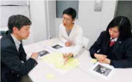
自分の意見をグループの人に伝えるとともに、他の人の意見も聞くと、違うアイデアが浮かんでくることも。

体験授業では、6人の参加者が2組に分かれ、グループディスカッションが行われました。一枚の写真を見てその状況を予想するという、実際の大学入試に使われた問題を用いて、アイデアを出し合いながら一つの仮説を作っていきます。途中、写真の時代背景に目を付けたグループが、スマートフォンで情報を集める場面もありました。「覚えているかを試す課題ではないので、疑問に思うことがあれば積極的に調べてくだ