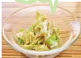
キャベツの胡麻和え