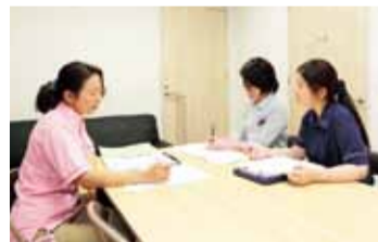
かんでんジョイライフは女性の活躍が目覚ましい