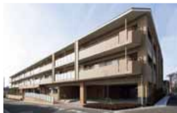
2015年3月にオープンした「ユトリム箕面桜ヶ丘」(箕面市)