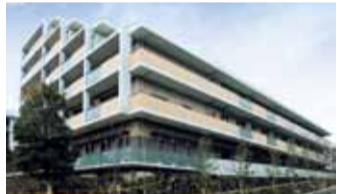
緑豊かな公園に囲まれた「ベルパージュ千里けやき通り」(吹田市)

介護業界に飛び込んで17年。介護職、相談員、管理者、営業などを経て2014年、ベルパージュ千里けやき通りに入職。2015年から現職。「ゆつたりとした雰囲気は、お客さまがご自分のスタイルを持っていらっしゃるから。人生の大先輩に教えられることも多いですね」。