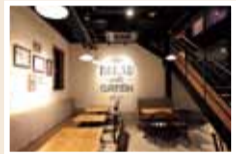
カジュアルで広々とした店内。1Fと2Fに席が設けられている。

Menu ▶ ランチセット…1,500円(税別) メイン(パスタグラタンorブレントスト)、サラダ、スープ、自家製パン、食べ放題、ドリンクバー ※生ハムと旬野菜のフレッシュトマトソースは+200円で注文可 特典 この記事持参で ▶ ミニデザートプレゼント ※ランチorディナーご利用の方、4月末まで