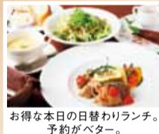
お得な本日の日替わりランチ。予約がベター。

Menu ▶ パスタランチ(サラダ・パン付き)…850円 ▶ グラタンランチ(サラダ・パン付き)…950円※数量限定 ▶ Lunchコース…2,160円(前菜の盛り合わせ・パン・パスタ・メインドルチェ・カフェ) 特典 この記事持参で ▶ ランチ注文の方、…セットドリンク無料(4月末まで)