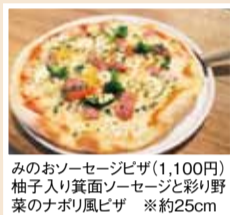
みのおソーセージピザ(1,100円) 柚子入り黄面ソースと彩り野菜のナポリ風ピザ ※約25cm

Menu ▶ 牛肉のガーリックライス…1,000円 ※ディナーのみ ▶ フルーツパンケーキ…900円 ※パンケーキの提供は15時以降 特典 「シティライフを見た」とディナー予約で ▶ 会計より10%OFF(4月末まで)