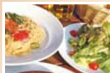
お得なランチメニュー、日替わりでたのしめる。

Menu ▶ パスタランチ(サラダ・パン付き)…850円 ▶ グラタンランチ(サラダ・パン付き)…950円※数量限定 ▶ Lunchコース…2,160円(前菜の盛り合わせ・パン・パスタ・メインドルチェ・カフェ) 特典 この記事持参で ▶ ランチ注文の方、…セットドリンク無料(4月末まで)