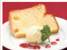
口どけ滑らかな ふわふわシフォンケーキ。

Menu ▶ パスタセット…1,300円～2,100円 ▶ ハンバーグランチセット…1,150円 特典 「シティライフを見た」でランチ注文の方、 ▶ 手作りふわふわシフォンケーキをサービス(4月末まで)