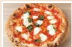
世界2位を獲得したマルゲリータクラシック1,296円。