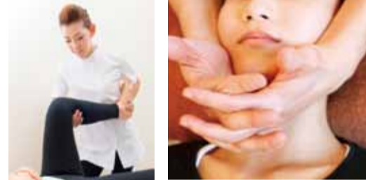
阪急茨木市駅から徒歩3分と駅チカで通いやすい。

健康的にキレイをサポートしてくれる美容整骨サロン。小顔美容整骨矯正では、気になるアゴのゆがみやエラの張り・ほほ骨などのお悩みを骨格から徹底改善し、小顔効果を実感。1回の施術でも効果は大きく、化粧したままでOKなのがうれしい!骨格のゆがみを整えて、理想の小顔へ!