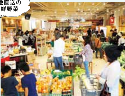
店頭精米のお米は、【会員様価格】三重県産コシヒカリ 玄米1kg 当たり税込270円。会員特典でお米やイチオシ商品が割引に。無料登録なので、ぜひ入会してみてください!

奈良・三重・和歌山の産直野菜や漁港直送の鮮魚を種類も豊富に販売。添加物を抑えた食品や産直ならではの珍しい野菜が並ぶことも。食べ方なども気軽に相談できる。お米は、その場で精米してくれるので、鮮度抜群!ぜひ行ってみて!