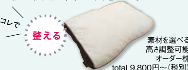
素材を選べる高さ調整可能オーダー枕 total 9,800円(税別)

睡眠はその日の疲れをとるために成長ホルモンが分泌されるので、ぐっすり眠るために枕を見直す人が増えているとか。自分に合う枕に変えることで頭痛、肩こりやむくみ、寝起きのだるさなどが改善したと喜びの声も多い。わたや館では測定したデータを元に、6種類ある中材から好みの素材を選び、1グラム単位で量を調整して枕を作成できる。良好な睡眠環境は美容効果も期待できていいことだらけ。自分だけのぴったりに枕で快適な眠りを実感して。