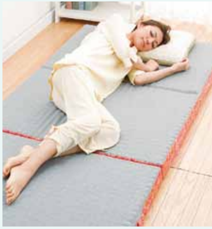
家に持ち帰って試せる「3泊4日のお試しレンタル」が可能。気に入ればそのまま購入ができ、アフターフォローもしてくれるので安心。