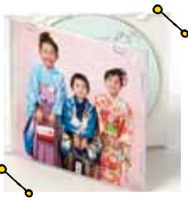
「写真ジャケット付全画像CD」 年賀状作成が自分でできると好評!

スタジオを貸切にしてたくさんのポーズを撮影し、その場で納得の写真が選べる同店。今なら全プランに撮影した全データがもらえる!お祝いプラン「華Hana」セットはフィナーとキャビネ2面が2冊ついて18,425円(税別)と驚きの低価格。秋のおでかけレンタルがセットの『さくら満足プラン』など超お得なプランがいっぱい!