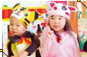
毎日の英語シャワーでキレイな発音が身につく。楽しいイベント盛りだくさん!