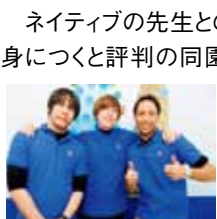
楽しく優しいネイティブの先生たち。みんな先生が大好き!

吹田 English School イマジンJAPAN CLOVER児童園 (クローバー) 吹田市上大手町21-28 メゾンティン2F 06-6368-3412 http://www.suita-clover.jp/