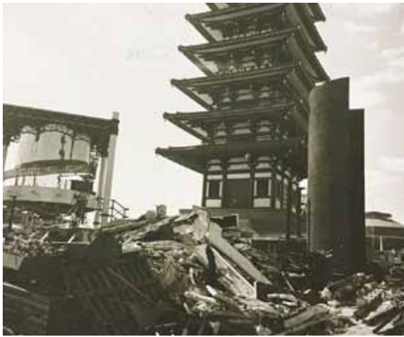
日本万国博覧会後の撤去のようす。背後の塔は「古河パビリオン」。

過去の万博では、跡地の有効利用が重視されており、会場計画の段階ですでに跡地利用の計画を立て、これを前提に会場を建設している。観光地として有名なエッフェル塔も、1889年に行われたパリ万博の遺産だ。こうして跡地のほとんどが公園や文化施設として活用され、都市の発展に大