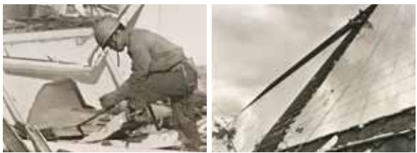
エキスポタワーは2002年8月から2003年3月にかけて解体・撤去された。