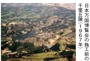
日本万国博覧会の施工前の千里丘陵(1967年)